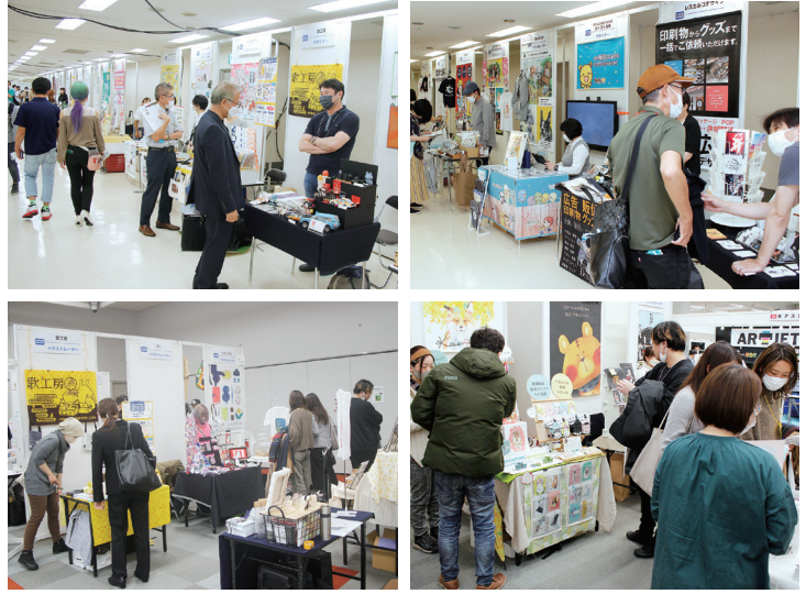
※写真は全て過去に開催されたクリエイターゾーンの様子

本展示会は1981年に産声を上げた、オリジナルグッズづくりのプロが集まる展示会です。会場には、印刷やスタンプ、Tシャツプリント、雑貨などをオリジナルで小ロット加工するための機器や商材が多数展示され、近年は3,200～3,900名の来場者が全国から訪れています。Tシャツ、スマートフォンケース、缶バッジ、名刺といったオーダーグッズづくりの現場では、イラストやロゴマーク、写真画像などのデザインコンテンツが欠かせません。また、それらの製造システムや無地商材のメーカーも、販促用サンプルに使うイラストなどを求めています。そこでオーダーグッズビジネスショーでは、それらのデザインコンテンツを求める企業と、クリエイターの皆さまの出会いの場として「クリエイターゾーン」を設けています。デザイナー、クリエイター、フォトグラファーなどの皆さまに、ぜひご出展をいただき、新しいビジネスや人脈の拡大にご活用いただければ幸いです。